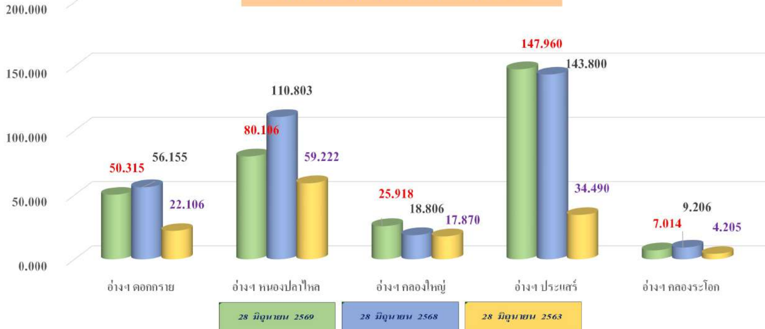
กราฟเปรียบเทียบปริมาณน้ำในอ่างฯ 3 ปี